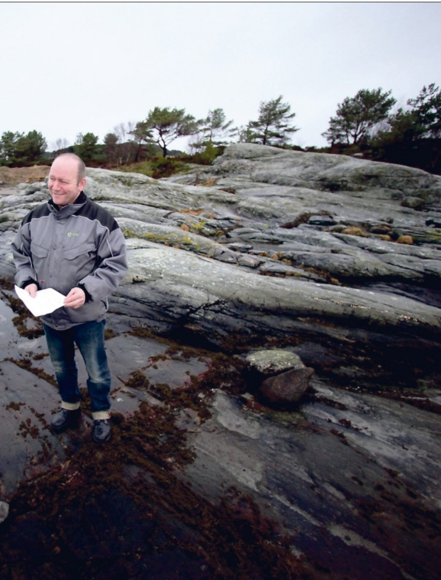
kin AS har skrive kontrakt på mellom anna bygging av kai og bål plass i folkeparken.