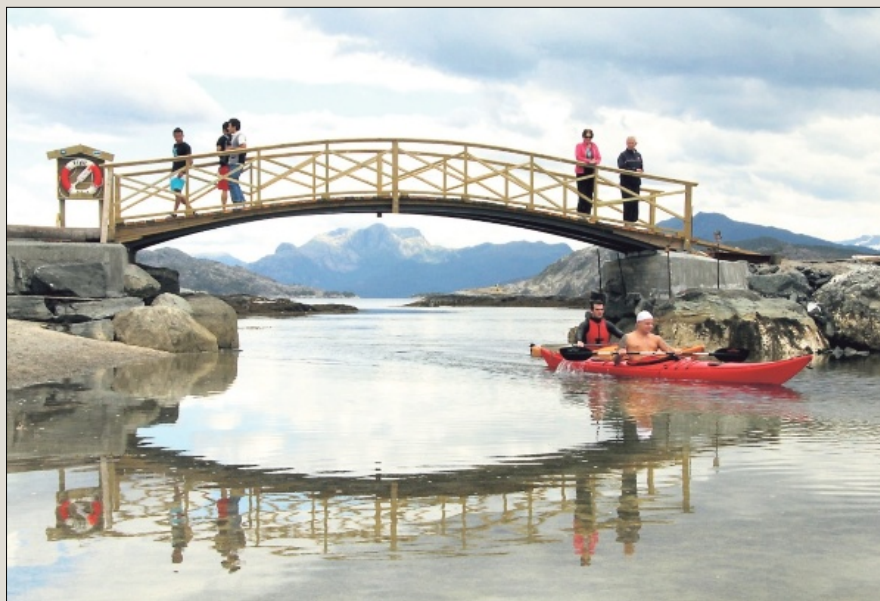
– Stemningsbilde tatt på Sørstrand Folkepark søndag 29. juli klokka 13.57. Mange er ute på tur for å sjå den flotte brua som er komen opp. All honnør til dei som står bak arbeidet, seier innsendaren.